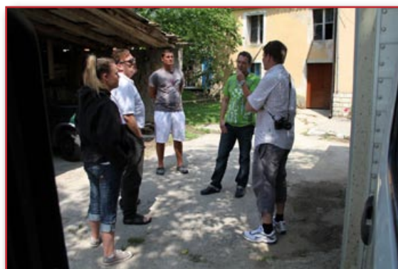
Dom za rehabilitacijo odvisnikov društva Izhod

Vsi, ki se želite pridružiti rednim dobrotnikom Božje besede, lahko to storite preko naše spletne strani www.svetopismo.si/dobrodelno.html kjer boste v razdelku »Darovanje prostovoljnih prispevkov« našli pristopnico.