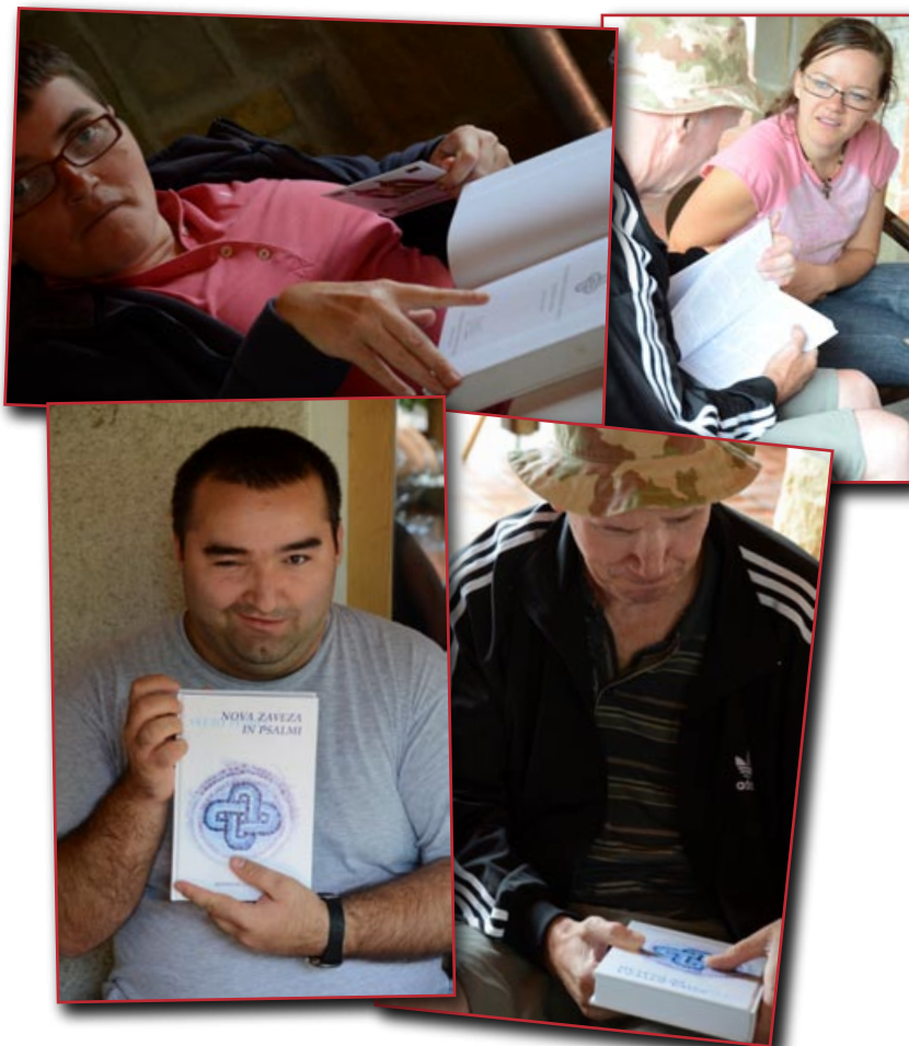
Božja beseda v centru Sonček

Od lanskega božiča ste za projekt Luč v temi darovali 3.153,50 EUR. S temi sredstvi smo v letošnjem letu do zaključka redakcije podarili 40 celotnih Svetih pisem, 44 Novih zavez ter 296 izvodov ostale biblične literature. V imenu vseh, ki so zaradi vaše dobrote prejeli lasten izvod Svetega pisma ali drugo biblično literaturo, se vam iskreno zahvaljujemo!