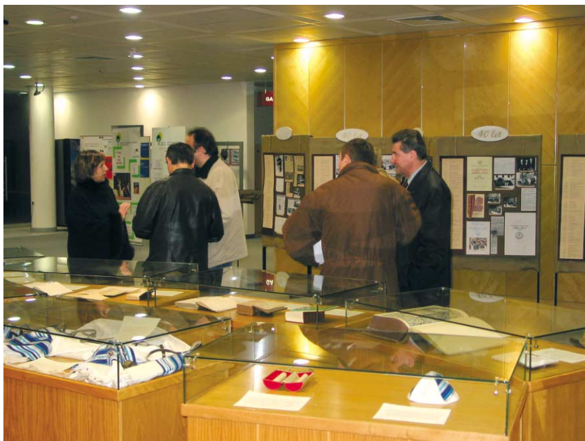
Utrinek z otvoritve svetopisemske razstave v Pokrajinski in študijski knjižnici v Murski Soboti

ljal tudi celomesečni svetopisemski simpozij, na katerem so strokovnjaki z različnih fakultet in znanstvenih inštitutov razpravljali o Svetem pismu.