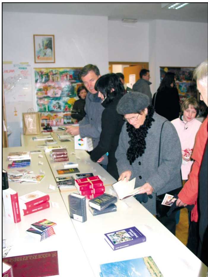
Po predstavitvi Svetopisemske družbe si obiskovalci ogledujejo našo knjižno ponudbo

Vse naše podpornike in prostovoljce vabimo, da se Svetopisemska družba predstavi tudi v vaši cerkvi ali