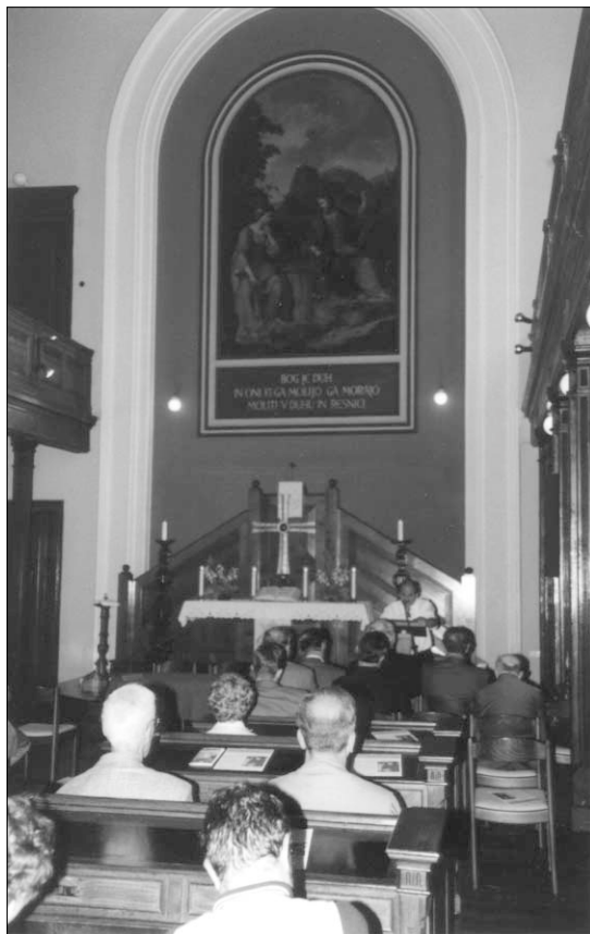
Občni zbor v evangeličanski Cerkvi

Predsednik in generalni tajnik sta se udeležila svetovne skupščine Združenih svetopisemskih družb v Južni Afriki. To je bila pisana družčina iz 140 držav, še posebej tistega večera, ko so se mnogi pojavili v svojih narodnih nošah. Paša za oči ... Sicer smo teden dni trdo delali in sprejeli nekaj pomembnih smernic za naše bodoče delo. Na kratko: Kako vsakemu človeku na tem planetu zagotoviti izvod Svetega pisma v njegovem jeziku in na mediju, ki je zanj uporaben in ga pritegne, ter kako sploh navdušiti posameznike za branje Knjige. Glede na to, da se distribucija Svetega pisma občutno veča prav v Afriki, bi lahko dejali,