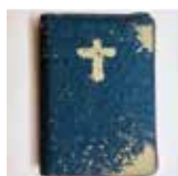
Sveto pismo mali žepni format z zadrgo, jeans 29,50 €

V naši knjigarni so na voljo še vedno sveži formati in ovitki Svetih pisem! Izbirate lahko med kar sedmimi novimi izdajami, med katerimi boste našli široko paleto žepnih izdaj (z zadrgo ali brez) , ki so primerne za potovanja in vsakodnevno nošnjo , da vas bo Božja spremljala resnično na vsakem koraku. Tu je tudi posebna izdaja Svetega pisma s povečanimi črkami za vse tiste, ki vam je pisava običajnih izdaj premajhna.