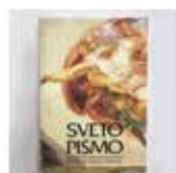
Sveto pismo v večji pisavi 42,50 €