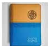
Sveto pismo mali luksuzni žepni format z zadrgo, 25,00 €