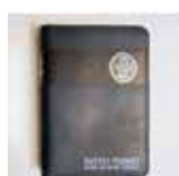
Sveto pismo žepni format z zadrgo, brez DC 29,00 €