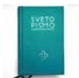
Sveto pismo mali žepni format, trda vezava 18,00 €