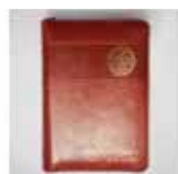
Sveto pismo žepni format z zadrgo 29,00 €