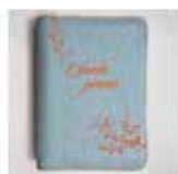
Sveto pismo mali žepni format z zadrgo, jeans 29,50 €