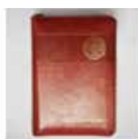
Sveto pismo žepni format z zadrگو 29,00 €