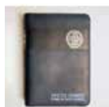
Sveto pismo žepni format z zadrگو, brez DC 29,00 €