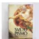
Sveto pismo v večji pisavi 42,50 €