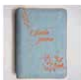
Sveto pismo mali žepni format z zadrگو, jeans 29,50 €