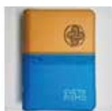
Sveto pismo mali luksuzni žepni format z zadrگو, 25,00 €