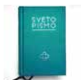
Sveto pismo mali žepni format, trda vezava 18,00 €