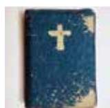
Sveto pismo mali žepni format z zadrگو, jeans 29,50 €

V našo knjigarno so ravno prišla nova Sveta pisma! Izbirate lahko med kar sedmimi izdajami. Med novimi izdelki najdete žepne izdaje (z zadrگو ali brez), končno pa tudi Sveto pismo s povečanimi črkami za vse tiste, ki vam je drobna pisava običajnih izdaj premajhna.